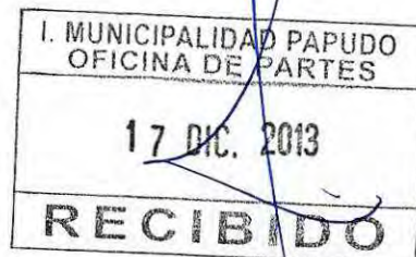
RICARDO PROVOSTE ACEVEDO Contralor Regional Valparaíso CONTRALORÍA GENERAL DE LA REPÚBLICA